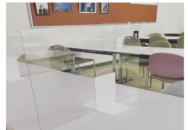
食堂にアクリル板を設置しています