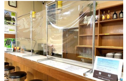
フロントに飛沫防止シールド設置